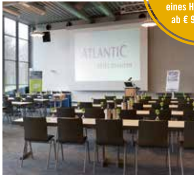
ATLANTIC Hotel Universum – Tagungsraum