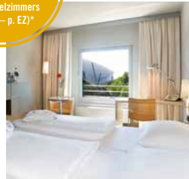
ATLANTIC Hotel Universum – Hotelzimmer