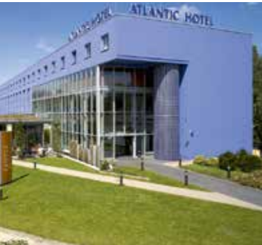
ATLANTIC Hotel Universum – Tagungshotel

(für die Reservierung eines Hotelzimmers ab € 93,- p. EZ)*