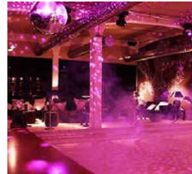
HUDSON EVENTLOFT – Party

ATLANTIC Hotel Universum · Wiener Straße 4 · 28359 Bremen Tel. +49 421 24670 · universum@atlantic-hotels.de · www.atlantic-hotels.de/hotel-universum-bremen